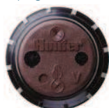
I-40 haute vitesse Disponible en tant qu'option préinstallée sur tous les modèles