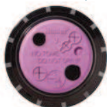
I-40 Eaux Usées Disponible comme option montée en usine sur tous les modèles

▶ = Descriptions détaillées des caractéristiques à la page 18